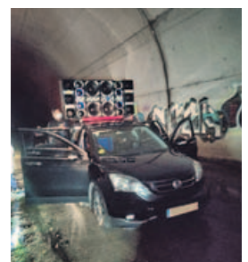
El coche con altavoces en el túnel.

Además, al propietario del automóvil con bafles gigantes se le denunció por infringir la ordenanza contra la contaminación acústica.